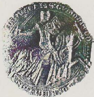
Afbeelding 2: Graaf van Vlaanderen Gwijde van Dampierre

Het Graafschap Vlaanderen was eind 13e eeuw een welvarend gebied en voerde een eigen koers. Het was wel afhankelijk van Frankrijk, maar economisch gezien was het veel meer afhankelijk van Engeland door de wol- en lakenhandel. Belangrijke steden in de tijd waren Gent, Ieper, Kortrijk en natuurlijk de havenstad Brugge. Frankrijk begon in 1294 een oorlog tegen Engeland en de Vlamingen kozen de kant van Engeland.