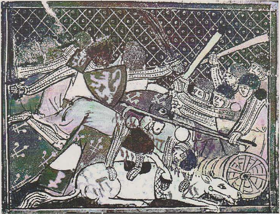
Afbeelding 4: Gulden Sporenslag

Voor de aanhangers van de graaf was het nu wel duidelijk: het kon niet uitblijven dat er een gewapend treffen met de Fransen zou komen. Onder leiding van Willem van Gulik, een kleinzoon van de graaf, en Gwijde van Namen, een zoon van de graaf, werd een leger georganiseerd dat bestond uit gewone mensen zoals ambachtslieden, boeren, poorters en enkele ridders. Dit leger werd vooral door de stad Brugge gefinancierd. In juni 1302 vertok er een Frans leger richting Vlaanderen om zich op de slachting te wreken. Het Franse leger dat uit totaal 8500 man bestond arriveerde 8 juli bij Kortrijk. Het Vlaamse leger bestond uit 9000 man waarvan maar 400 edelen te paard. Dit leger had zich buiten de stad Kortrijk opgesteld achter de Grote beek en de Groeninge beek. In de middag van 11 juli begon de aanval. Daar de ridders zelf zich wilden wreken, moest het voetleger in de aanval ruimte voor hen maken.