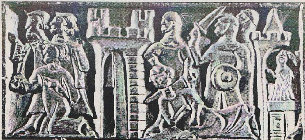
Afbeelding 3: Brugse metten

De Franse koning Filips IV stelde de Franse landvoogd Jacques de Châtillon aan om het Graafschap Vlaanderen te beheren. De Franse koning hield in mei 1301 in de Vlaamse steden een blijde intrede. Een deel van de hoge belastingen werd afgeschaft. Die afschaffing van de hoge belastingen kwam echter meer in het voordeel van de patriciërs (Fransgezinden) dan van het ambachtvolk, de aanhangers van de graaf. Er ontstond onrust tussen de Leliaarts (Fransgezinden) en de Klauwaarts (aanhangers van de graaf). Pieter Coninck, een populaire wever uit Brugge, probeerde op te komen voor de zaak van de ambachtlieden maar werd door het stadsbestuur als oproerkraaiër gezien en uit de stad verbannen. In 1302 ontstond door belastingverhogingen grote onvrede onder Klauwaarts en werden in de steden Gent en Brugge door de aanhangers van de graaf de Fransgezinden de stad uitgegoid. De landvoogd Jacques de Châtillon organiseerde een leger om deze steden weer te ontzetten. Toen dit kleine leger Brugge weer had bezet werden zij in de nacht van 18 mei 1302 massaal afgeslacht (Brugse metten) door een leger van ambachtlieden onder leiding van Pieter Coninck. De landvoogd kon op het nippertje ontkomen en vluchtte terug naar Frankrijk.