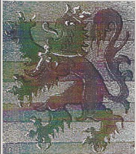
Afbeelding 1: De leeuw op de pijpenkop en dezelfde leeuw in het stadswapen van Brugge